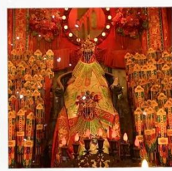
เจ้าแม่กวนอิมวัดสองอ่า