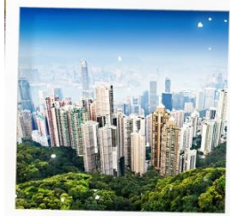
จุดชมวิวกาวิคตอเรีย